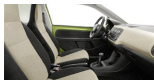
Club Reverse ivory

ID konfigurace: NF13A1, 2012, GD, 0W0W,GPJBPJB, dokončená konfigurace, 16. listopadu 2011 11:20